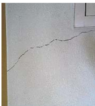
▲ Enkele voorbeelden van bevingsschade, gefotografeerd door gedupeerden.